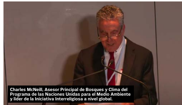
Charles McNeill, Asesor Principal de Bosques y Clima del Programa de las Naciones Unidas para el Medio Ambiente y líder de la Iniciativa Interreligiosa a nivel global.

IRI-Colombia participó el pasado 3 de noviembre en el seminario web “Hacer la paz con la naturaleza: atendiendo a la llamada de los pueblos indígenas”, organizado por la Iniciativa Interreligiosa para los Bosques Tropicales a nivel global, el Consejo Mundial de Iglesias, la Comunión Anglicana, la Iglesia Episcopal y Religiones por la Paz. Este seminario se celebró en el marco de la Conferencia sobre el Medio Ambiente de la ONU, COP26, en Glasgow, Escocia. El seminario buscaba analizar buenas prácticas en la implementación local y nacional de compromisos de las comunidades religiosas con los pueblos indígenas para la protección de la Amazonia. También sirvió para anunciar el inicio de la segunda fase de la Iniciativa Interreligiosa para los Bosques Tropicales en los cinco países donde se encuentra instalada –Colombia, Brasil, Perú, Indonesia y República Democrática del Congo– y el apoyo del gobierno noruego a este programa.