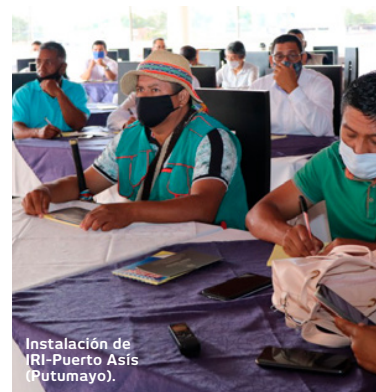
Instalación de IRI-Puerto Asís (Putumayo).

Para finalizar, IRI-Colombia seguirá en contacto con todas las personas y organizaciones que están vinculadas a la Iniciativa, a través de sus publicaciones habituales —IRIBoletín y El bosque es vida—, de columnas de opinión y entrevistas difundidas en medios de comunicación locales y nacionales, y de la emisión de una radio revista, emitida en medios regionales y comunitarios. Adicionalmente, continuará sensibilizando a la ciudadanía acerca de la urgencia de la protección de los bosques tropicales y desarrollará una campaña de comunicación de “desinversión en la deforestación”.