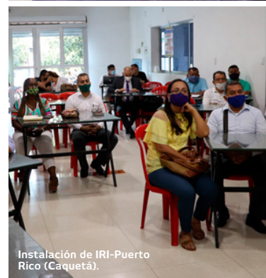
Instalación de IRI-Puerto Rico (Caquetá).