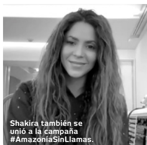
Shakira también se unió a la campaña #AmazoníaSinLlamas.

La Iniciativa Interreligiosa para los bosques tropicales, IRI-Colombia, se unió durante el mes de enero a #AmazoníaSinLlamas, iniciativa del programa del Ministerio de Medio Ambiente y Desarrollo Sostenible, Visión Amazonía. Esta campaña colaborativa, que agrupa a organizaciones, instituciones y personas interesadas en el cuidado de la Amazonia, busca concientizar a la ciudadanía acerca del riesgo que implican los incendios forestales y la urgencia de proteger esta región de nuestro país. Consistió en la publicación en redes sociales de imágenes y videos en los que se presentan algunas cifras y datos importantes sobre el tema y una serie de videos en los que grandes personalidades nacionales como el ‘Pibe’ Valderrama, el cantautor Jorge Veloza o Shakira hacen un llamado a proteger la Amazonia colombiana. “Los invito a conservarla, a cuidarla, protegerla. Y hago un llamado para que no se tumben los árboles, para que no se quemé la selva, porque la Amazonia en pie garantizará que tengamos agua, que el planeta no se siga calentando y que siga la vida en la Tierra”, expresó la cantante barranquillera.