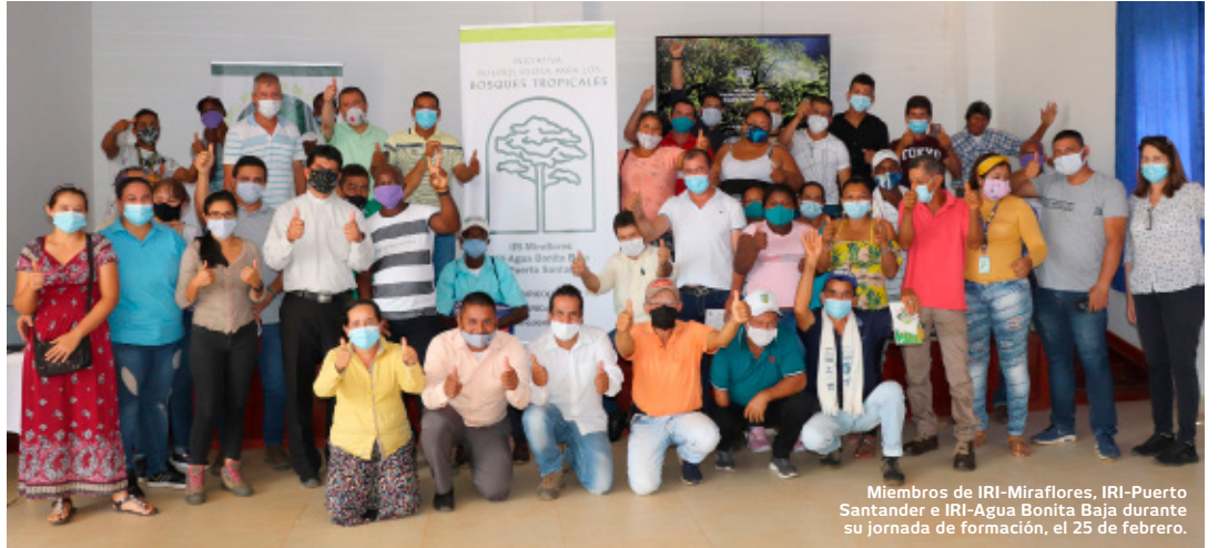
Miembros de IRI-Miraflores, IRI-Puerto Santander e IRI-Agua Bonita Baja durante su jornada de formación, el 25 de febrero.

interacciones obtuvieron nuestras publicaciones en Twitter, Facebook e Instagram.