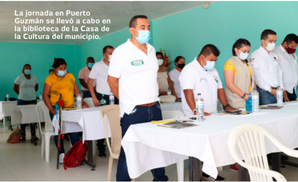
La jornada en Puerto Guzmán se llevó a cabo en la biblioteca de la Casa de la Cultura del municipio.