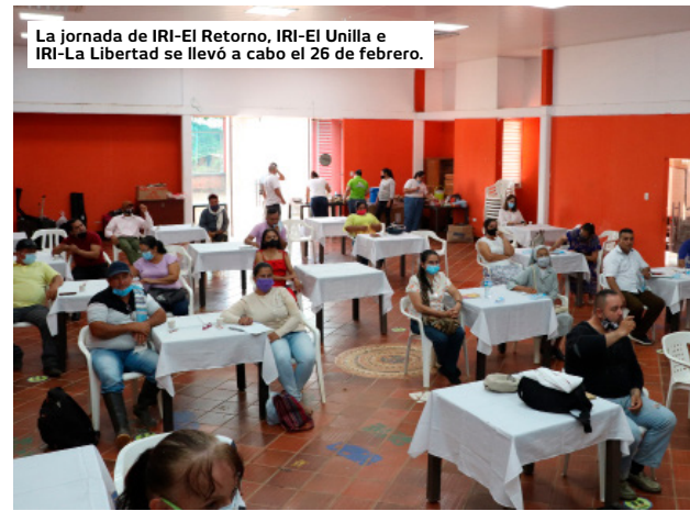
La jornada de IRI-El Retorno, IRI-El Unilla e IRI-La Libertad se llevó a cabo el 26 de febrero.

Durante estos encuentros, los líderes religiosos, indígenas, activistas ambientales, dirigentes políticos y demás miembros de IRI participaron de un taller dedicado al diseño de planes de acción, en el que realizaron un ejercicio de cartografía social para el reconocimiento del territorio, y de otro sobre acción pastoral, en el cual analizaron los conceptos y metodologías indispensables para llevar a cabo acciones pastorales estratégicas que impulsen la defensa de los bosques tropicales, la restauración de los ecosistemas degradados o destruidos y el reconocimiento de los derechos especiales de los pueblos indígenas colombianos.