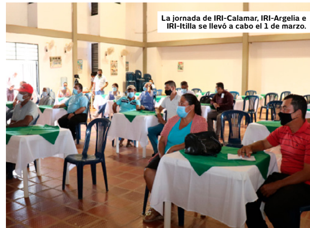
La jornada de IRI-Calamar, IRI-Argelia e IRI-Itilla se llevó a cabo el 1 de marzo.

Como resultado, los doce IRI locales del departamento de Guaviare formularon un Plan de Acción para este año –enfocado en el territorio y el derecho al ambiente sano–, articulado a un Plan de Acción Pastoral.