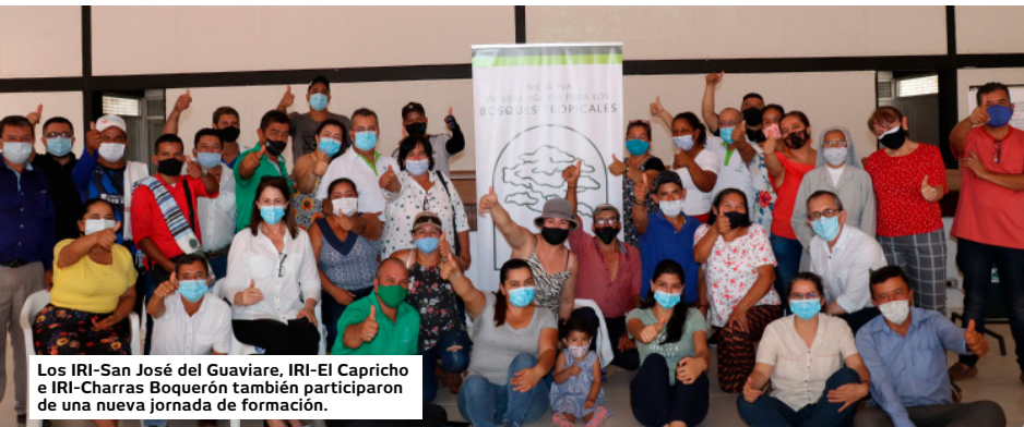
Los IRI-San José del Guaviare, IRI-El Capricho e IRI-Charras Boquerón también participaron de una nueva jornada de formación.