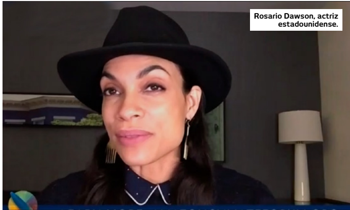
Rosario Dawson, actriz estadounidense.