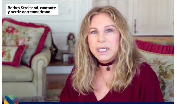
Barbra Streisand, cantante y actriz norteamericana.