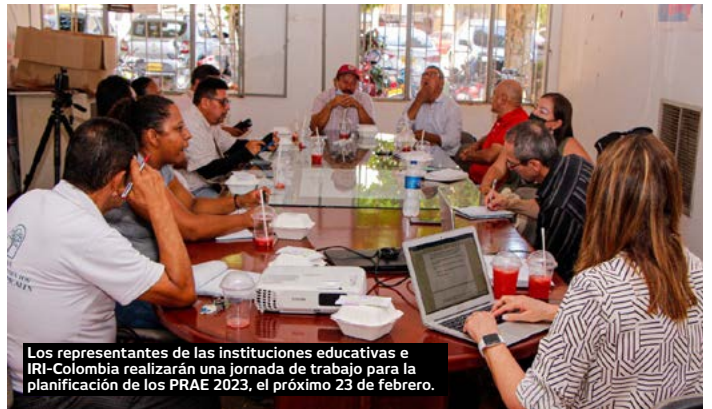
Los representantes de las instituciones educativas e IRI-Colombia realizarán una jornada de trabajo para la planificación de los PRAE 2023, el próximo 23 de febrero.