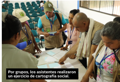
Por grupos, los asistentes realizaron un ejercicio de cartografía social.

Además de presentar la Iniciativa y hacer de manera oficial la instalación de los tres capítulos locales, durante esta jornada los asistentes participaron en un proceso de