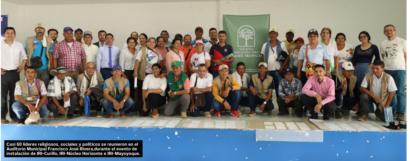
Casi 60 líderes religiosos, sociales y políticos se reunieron en el Auditorio Municipal Francisco José Rivera durante el evento de instalación de IRI-Curillo, IRI-Núcleo Horizonte e IRI-Mayochoque.