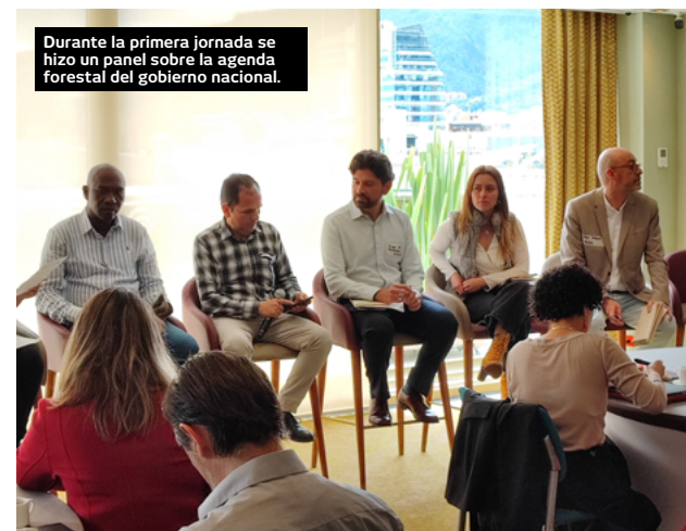
Durante la primera jornada se hizo un panel sobre la agenda forestal del gobierno nacional.

“Para los núcleos de desarrollo de la economía forestal se priorizaron 28 áreas a nivel nacional, de las cuales 22 se ubican en la Amazonia. Este programa se basa en un proceso de transformación de los núcleos de deforestación, donde se trabajará en manejo sostenible del bosque”, señaló el funcionario del Ministerio de Ambiente y Desarrollo Sostenible.