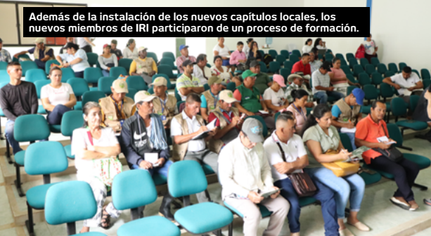
Además de la instalación de los nuevos capítulos locales, los nuevos miembros de IRI participaron de un proceso de formación.