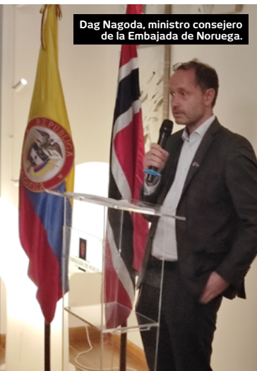
Dag Nagoda, ministro consejero de la Embajada de Noruega.