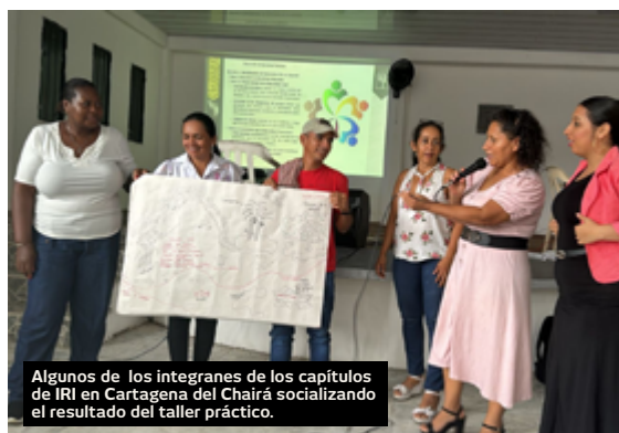
Algunos de los integrantes de los capítulos de IRI en Cartagena del Chairá socializando el resultado del taller práctico.