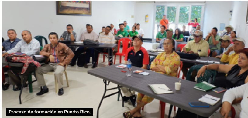
Proceso de formación en Puerto Rico.