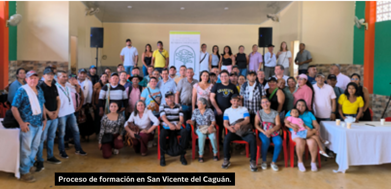
Proceso de formación en San Vicente del Caguán.