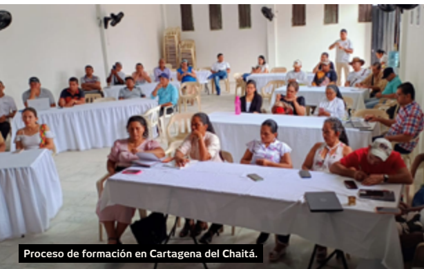
Proceso de formación en Cartagena del Chairá.

C rear conciencia sobre el papel crucial que cumplen los bosques tropicales amazónicos en la lucha contra el cambio climático y su aporte al bienestar de la humanidad, así como la urgencia de actuar para contribuir con su protección, es una de las principales líneas misionales de IRI-Colombia, que de manera periódica realiza procesos de formación para los integrantes de los capítulos locales, con el propósito de sensibilizarlos sobre estos temas y brindarles herramientas para que se conviertan en guardianes activos de la Amazonia.