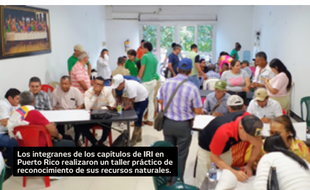
Los integrantes de los capítulos de IRI en Puerto Rico realizaron un taller práctico de reconocimiento de sus recursos naturales.