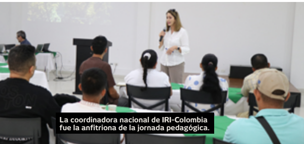
La coordinadora nacional de IRI-Colombia fue la anfitriona de la jornada pedagógica.