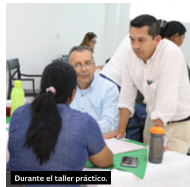
Durante el taller práctico.