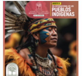
Publicación sobre el Día Internacional de los Pueblos Indígenas.