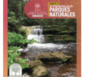
Publicación sobre el Día Internacional de los Parques Naturales.