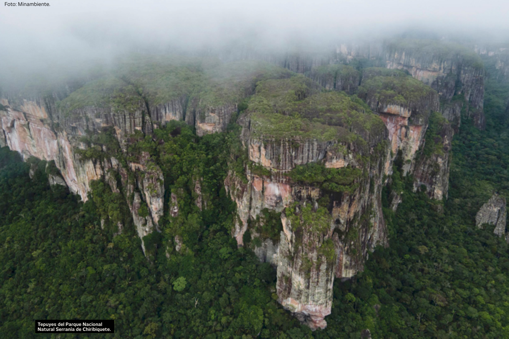
Tepuyes del Parque Nacional Natural Serranía de Chiribiquete.