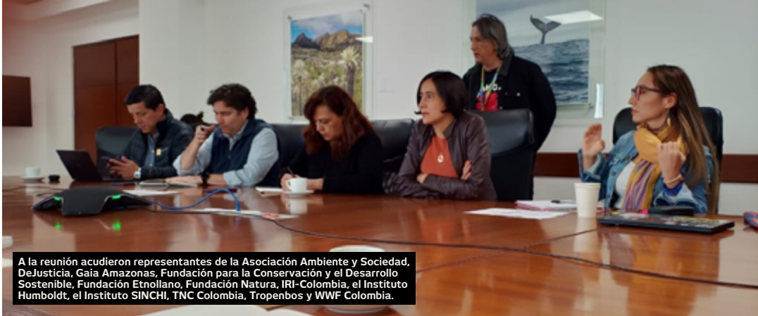
A la reunión acudieron representantes de la Asociación Ambiente y Sociedad, DeJusticia, Gaia Amazonas, Fundación para la Conservación y el Desarrollo Sostenible, Fundación Etnollano, Fundación Natura, IRI-Colombia, el Instituto Humboldt, el Instituto SINCHI, TNC Colombia, Tropenbos y WWF Colombia.