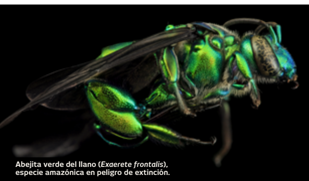
Abejita verde del llano ( Exaerete frontalis ), especie amazónica en peligro de extinción.