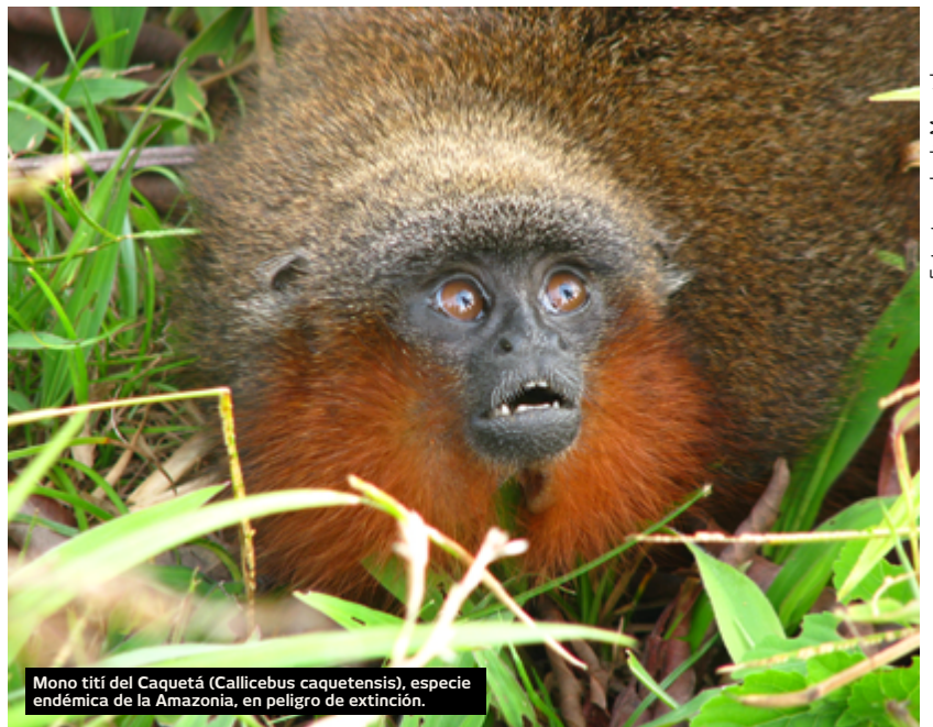
Mono tití del Caquetá ( Callicebus caquetensis ), especie endémica de la Amazonia, en peligro de extinción.

Que la COP16 sea un faro de esperanza y un punto de inflexión en nuestra lucha por un planeta donde se controle la pérdida forestal para que la biodiversidad florezca y las generaciones futuras puedan vivir en armonía con la naturaleza. No podemos fallar en esta misión sagrada. La Amazonia nos llama; es nuestro deber responder con fe, compromiso y acción.