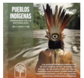
Publicación sobre el papel de las comunidades ancestrales en la conservación de la Amazonia, en el marco de la celebración del Día Internacional de los Pueblos Indígenas.

Síguenos a través de nuestras redes sociales y aprende más sobre los bosques tropicales.