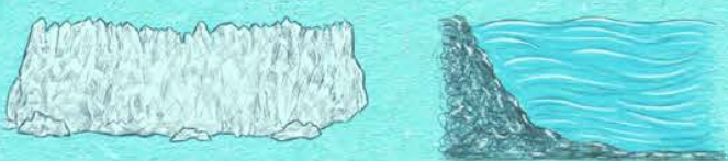
Los glaciares del mundo han venido desapareciendo a una velocidad sin precedentes, desde 1950.

Mientras el hielo del planeta desaparece, el nivel del mar aumenta y sus aguas se calientan. Según el informe, muchos de estos cambios no se podrán revertir hasta dentro de varios siglos o milenios.