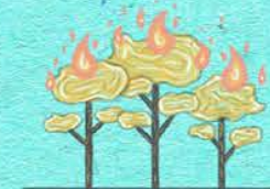
Con el aumento del calentamiento se intensificarán los ciclones tropicales y tormentas extratropicales, aumentarán las inundaciones y los incendios.

Hay una relación directa entre el calentamiento global y el cambio climático. Este último es irreversible, pues la temperatura terrestre seguirá aumentando al menos hasta mediados de siglo, sin importar el nivel de emisiones de gases de efecto invernadero.