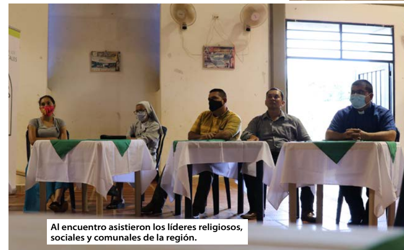
Al encuentro asistieron los líderes religiosos, sociales y comunales de la región.