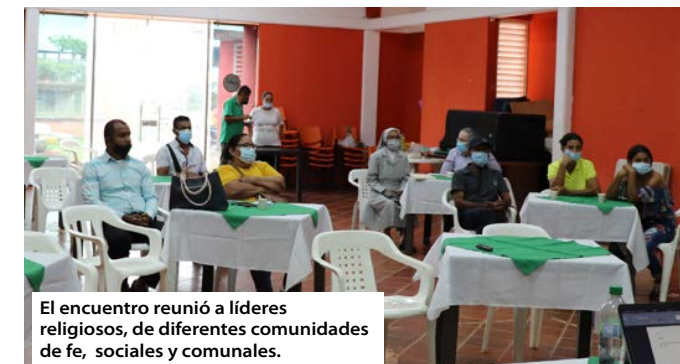
El encuentro reunió a líderes religiosos, de diferentes comunidades de fe, sociales y comunales.

“Como líder religioso siempre he estado dispuesto a trabajar por la unidad. Esto no se trata de doctrinas, sino de tomar conciencia”, expresó por su