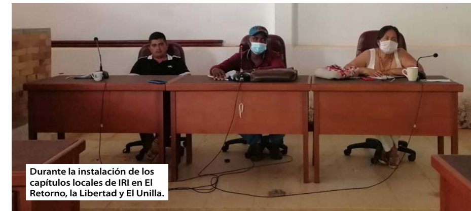
Durante la instalación de los capítulos locales de IRI en El Retorno, la Libertad y El Unilla.