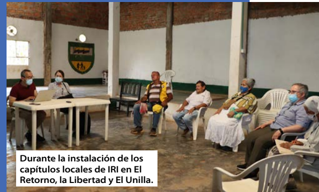
Durante la instalación de los capítulos locales de IRI en El Retorno, la Libertad y El Unilla.