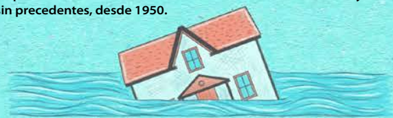
Las zonas costeras experimentarán un continuo asenso del nivel del mar a lo largo del siglo XXI, causando inundaciones costeras más frecuentes y graves en las zonas bajas.