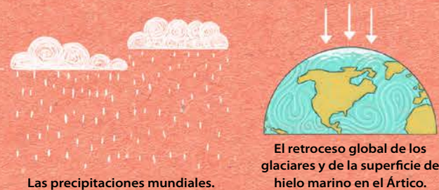
Las precipitaciones mundiales.

De acuerdo con el informe, la temperatura global del planeta ha aumentado 1.1°C desde 1850. La primera y más importante conclusión de este documento es que para la ciencia es evidente que este incremento es producto de la actividad humana que ha calentado la atmósfera, el océano y la superficie terrestre. Otras consecuencias son: