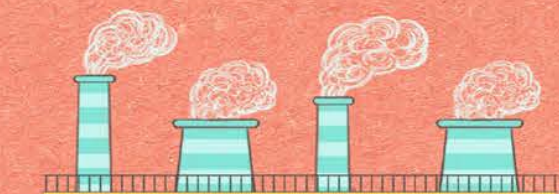
El aumento de las emisiones de gases de efecto invernadero y, por tanto, su concentración en la atmósfera.