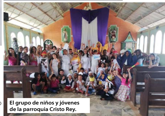
El grupo de niños y jóvenes de la parroquia Cristo Rey.