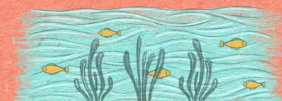
El calentamiento y la acidificación de los océanos, el aumento de las olas de calor marinas y la reducción en los niveles de oxígeno. Estos cambios afectan los ecosistemas marinos.