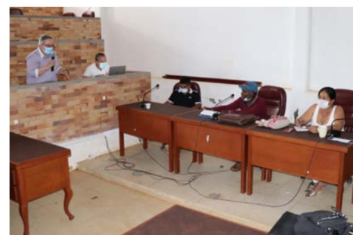
Durante la instalación de los capítulos locales de IRI en El Retorno, la Libertad y El Unilla.