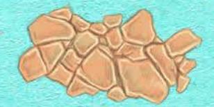
Cada 0,5°C adicionales de calentamiento global aumentará la intensidad y la frecuencia de los calores extremos y las precipitaciones intensas, así como sequías en algunas regiones.