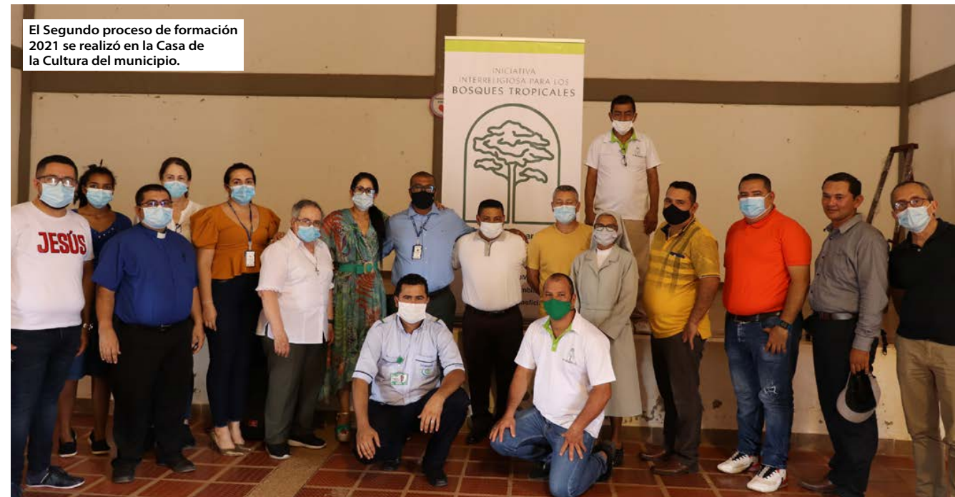
El Segundo proceso de formación 2021 se realizó en la Casa de la Cultura del municipio.

Durante el mes de septiembre IRI-Colombia continuó su gira por los municipios de Guaviare. En esta ocasión, llegó a Calamar y El Retorno para adelantar actividades de formación, incidencia política y de acciones conjuntas con el sector privado.