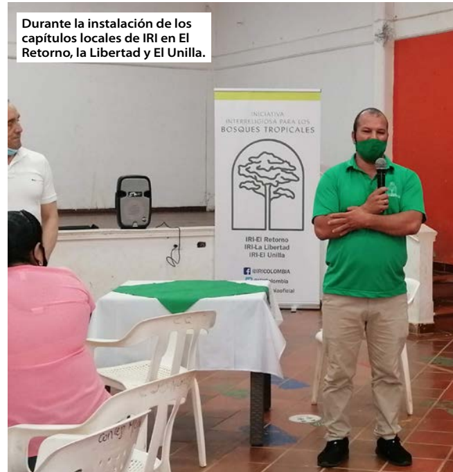
Durante la instalación de los capítulos locales de IRI en El Retorno, la Libertad y El Unilla.