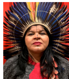
Panelista: Sonia Guajajara, coordinadora ejecutiva de la Articulación de Pueblos Indígenas de Brasil (APIB).