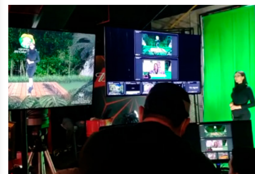
Momentos previos a la transmisión en vivo.