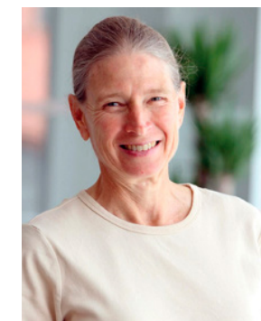
Frances Seymour, investigadora principal del World Resources Institute.

de incendios, pues cuando un bosque es talado se vuelve más seco y susceptible a las conflagraciones. “Hemos visto los titulares de los periódicos sobre enormes incendios en Brasil y Bolivia. ¿Por qué ocurren? Porque el entorno de los bosques está más seco y más caliente debido a la deforestación y los impactos del cambio climático”, señaló la investigadora, quien se desempeña actualmente en el aprovechamiento del potencial de los bosques para contribuir a la mitigación y adaptación al cambio climático. Para finalizar su presentación, Frances Seymour resaltó el patrón ascendente en las cifras de deforestación en Colombia durante los últimos cuatro años —impulsadas sobre todo por el cambio de uso de la tierra a la agricultura— y, especialmente, alertó sobre la nueva amenaza