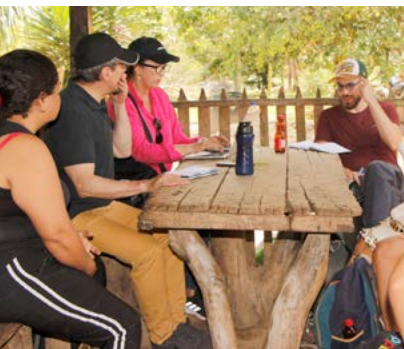
El equipo nacional de IRI-Colombia se reunió con miembros de IRI-Charras Boquerón.

La Secretaria de Educación se comprometió a convocar una reunión el 29 de septiembre, con los rectores de las 200 instituciones educativas de San José del Guaviare, El Retorno, Miraflores y Calamar, con el fin de crear un día dedicado a la protección de los bosques tropicales y la defensa de los derechos de los pueblos indígenas; sensibilizar a los estudiantes sobre la crisis de la deforestación, la emergencia climática y la urgencia de proteger la selva amazónica; y que los estudiantes de 6° a 11° formulen un plan de acción ambiental que incluya actividades como jornadas de reforestación —con plántulas que serán donadas por la Secretaria de Agricultura—.