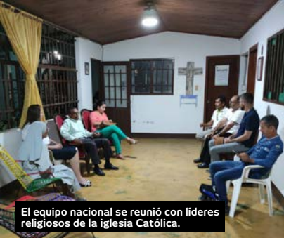
El equipo nacional se reunió con líderes religiosos de la iglesia Católica.