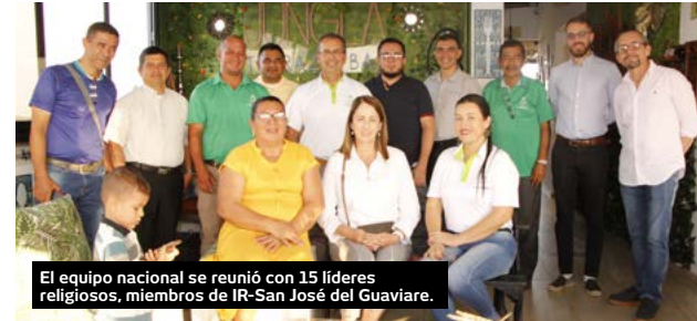
El equipo nacional se reunió con 15 líderes religiosos, miembros de IR-San José del Guaviare.

Además de los miembros de los capítulos locales de IRI, el evento contará con la participación de la Gobernación, la Secretaría de Gobierno, la Secretaría de Educación, colegios y universidades del municipio, medios de comunicación local y se espera que acudan alrededor de 1.500 personas.